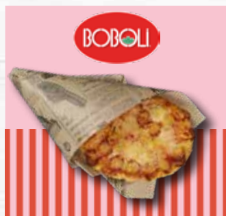
Boboli focaccia pepperoni 110g

Panini med asiatisk touch og grillstriper fylt med svinekjøtt, koreansk gulrotsalat og ost. 4 dagers holdbarhet på kjøll etter tining.