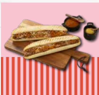
Panini korean pork 195g

Panini med grillstriper fylt med kyllingkebab, BBQ-saus, marinert agurk og ost. 4 dagers holdbarhet på kjøll etter tining.