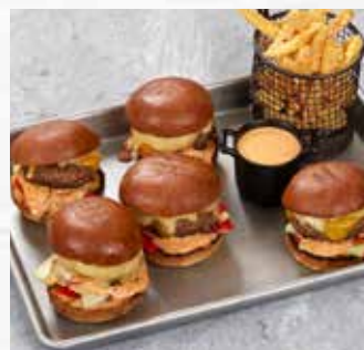
Hamburgerbrød potato slider 30g

Mykt og ekstra saftig burgerbrød bakt med potet. 11 cm i diameter, ferdig stekt og skåret.