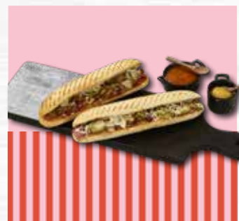
Panini kyllingkebab style 215g

Mykt og ekstra saftig sliderbrød bakt med potet. 8 cm i diameter. Passer utmerket til miniburgere. Ferdig stekt og skåret.