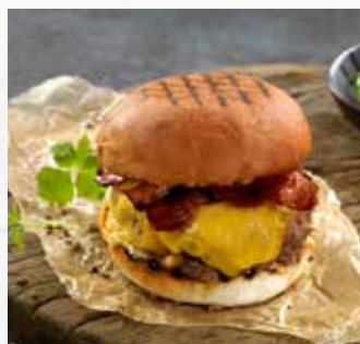
Hamburgerbrød potato 80g

Fiberrikt hamburgerbrød bakt i Norge med fermentert hvete for ekstra god smak. Toppet med sorte og hvite sesamfrø. 11 cm i diameter, ferdig stekt og skåret.