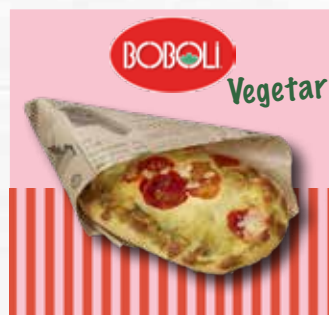
Boboli focaccia caprese 105g

Focaccia toppet med tomat-saus, pepperoni, gouda- og cheddarost. Bakt med italiensk durumhvete og olivenolje som gir en autentisk smak. Enkel håndtering og tilberedning.