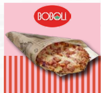
Boboli snackpizza skinke 120g

Smakfull vegetarfocaccia bakt med italiensk durumhvete og olivenolje. Toppet med mozzarella, goudaost, tomat og basilikummarinade. Enkel håndtering og tilberedning.