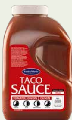
Taco Sauce Mild