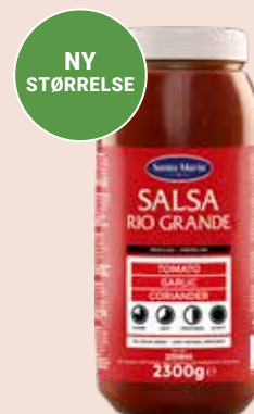
Rio Grande Salsa