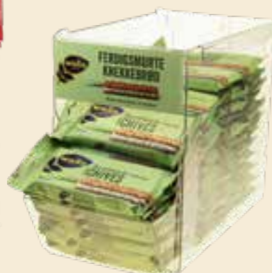
Plexikassett – kan stables